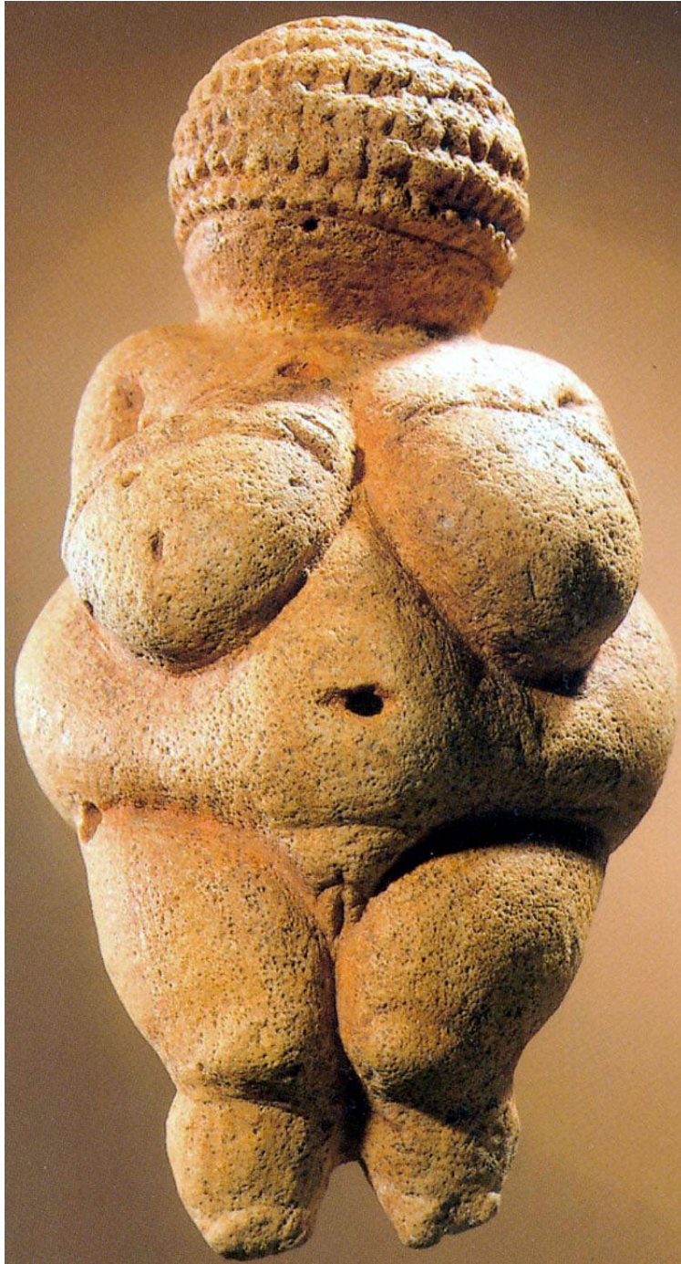
Venus de Willendorf

pensamiento arcaico. Fue, sin duda, el estrato primigenio sobre el que luego fueron añadiéndose otros.